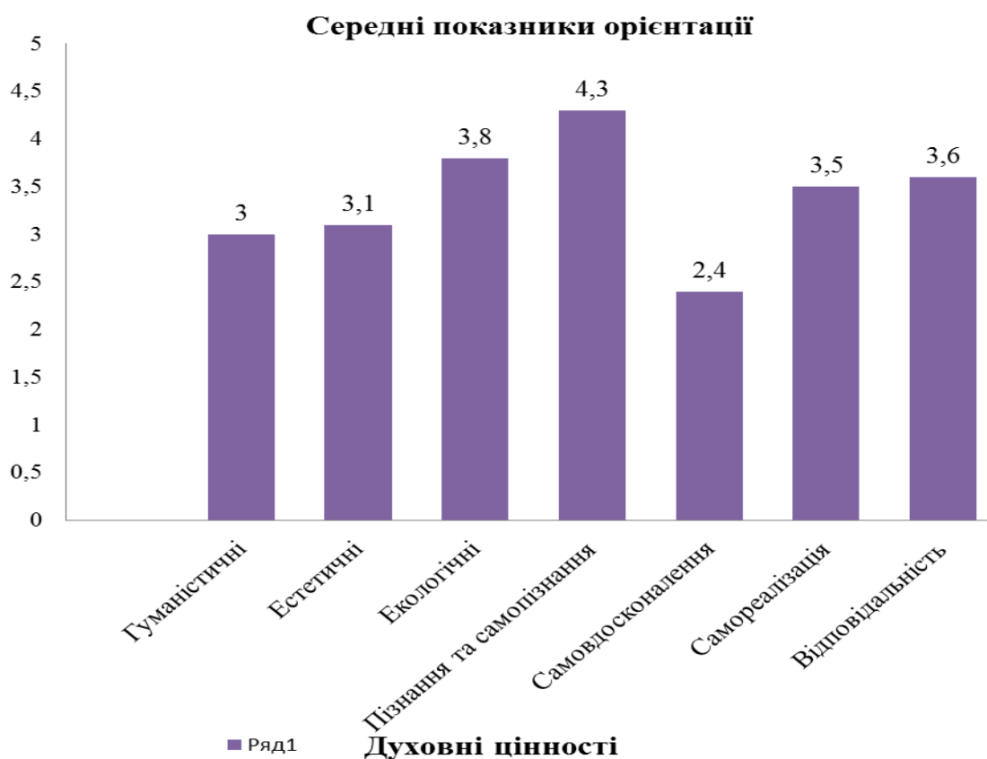
Рис. 3. Середні показники орієнтації студентів-психологів 3 курсу навчання на духовні цінності за результатами Інтегративної тестової методики «Духовний потенціал особистості» Е. О. Помиткіна