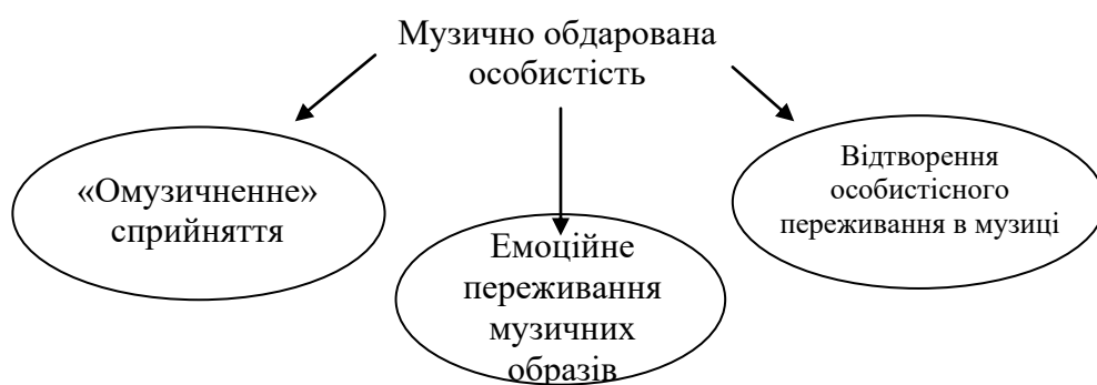
Рис.1. Основні особливості музично обдарованої особистості

художньої діяльності, тому що специфічним предметом мистецтва є відбиття найскладного різноманіття й динаміки людських переживань. Він відзначає, що мистецтво являє собою одну з вищих специфічних форм реалізації людських потреб у переживаннях. При цьому процес переживання не тільки є однією з операціональних складових діяльності, але й у деяких випадках виражає сутність самої діяльності, наприклад, музично-слухової [2, с. 352] (рис. 1).