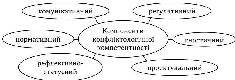
Рис. 2. Компоненти конфліктологічної компетентності

У своїх дослідженнях конфліктної компетентності А. Ю. Куликов та А. І. Шипілов включають у її структуру такі базові компоненти, як: відповідні спеціальні знання та вміння, навички управління конфліктними явищами й усунення негативних наслідків конфліктів, рефлексивну культуру [1]. У роботах В. Г. Зазикіна та О. І. Денисова саме ці компоненти складають основу гностичного, регулятивного, комунікативного, проектувального, рефлексивно-статусного та нормативного компонентів конфліктологічної компетентності суб'єктів освітньої діяльності [2; 4] (див. рис. 2).