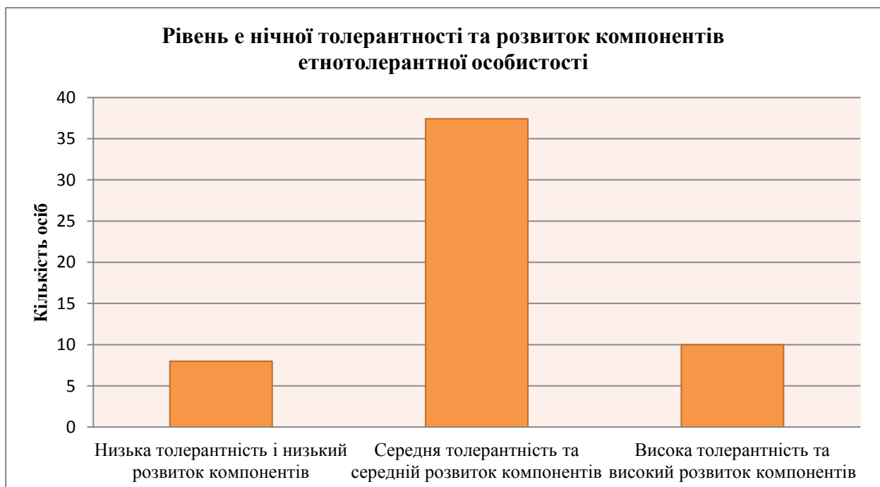
Рис. 2. Розподіл вибірки за рівнем етнічної ідентичності та розвитком когнітивного, афективного та конотативного компонентів

Подальший проведений аналіз дозволив поділити досліджуваних на групи відповідно до рівня їх етнічної толерантності та розвитку компонентів етнотолерантної особистості (рис. 2).