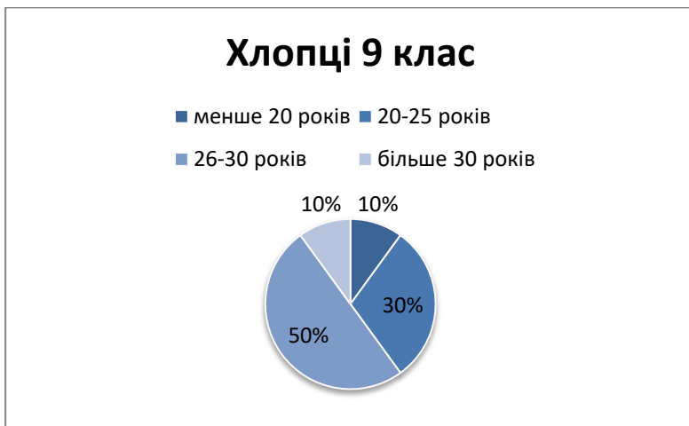
Малюнок 4. Бажаний вік вступу до шлюбу 9 клас, хлопці

Як бачимо із рисунку 4, 12 % хлопців-дев'ятикласників планують створення сім'ї після тридцяти років. В той час, як дівчата цього ж віку жодна не обрала для себе цей віковий діапазон, як бажаний для вступу у шлюб. Дана тенденція може бути як у площині різних підходів до соціалізації хлопців та дівчат, так і у площині підтвердження ймовірності слідування соціальним стандартам та відсутність індивідуалістичних тенденцій щодо можливого віку вступу у шлюб.