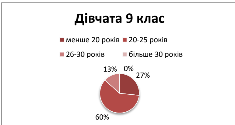
Малюнок 3. Бажаний вік вступу до шлюбу 9 клас, дівчата

раніше розпочинати роботу з діагностування уявлень особистості про шлюбно-сімейні стосунки. Наведемо результати дослідження бажаного віку вступу у шлюб дівчат дев'ятикласниць (див. Рис. 3.).