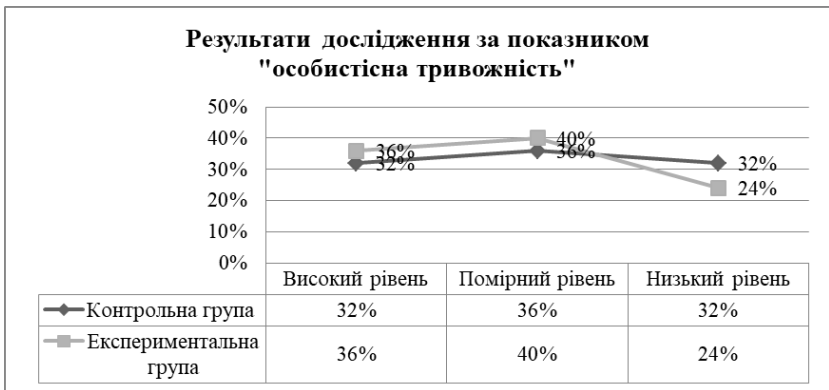
Рис. 2 Результати дослідження рівня тривожності за допомогою опитувальника Спілберга-Ханіна

Ситуативна тривожність - це стан спеціаліста, який характеризує ступінь його занепокоєння, турботи, емоційної напруги та розвивається за конкретною стресовою ситуацією. Якщо особистісна тривожність є стійкою індивідуальною характеристикою, то стан реактивної (ситуативної) тривожності може бути достатньо динамічним і за часом, і за ступенем вираженості.