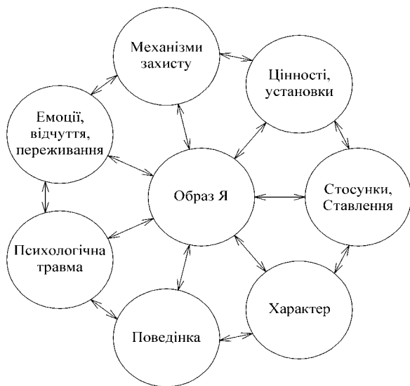
Рис. 2. Техніка "Мішені психологічного впливу"

Інструкція. Поділіться між собою на пари чи трійки. Виберіть хто першим буде у ролі клієнта, і у ролі психолога. Подумайте над тією особистісною проблемою, яку б Ви хотіли для себе прояснити, віднайти її причини і способи подолання. Коротко розкажіть про неї своєму партнеру.