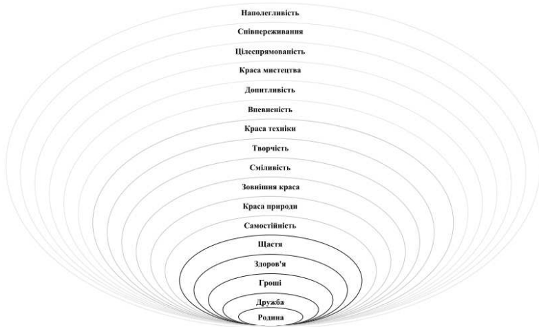
Рис. 1. "Поле цінностей" сучасного дошкільника

ру) та третій (далекій від центру). Використання вислову "поле цінностей" дозволяє доповнити його якісними додатковими характеристиками – найближче поле цінностей, віддалене та далеке поле цінностей.