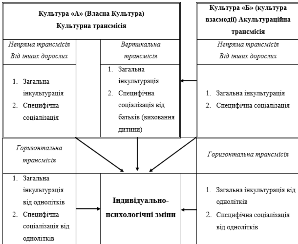
Рис. 2. Вертикальні, горизонтальні та непрямі культурні та акультураційні трансмісії

Для пояснення динамічної природи акультурації в контексті соціалізації варто розглянути рисунок 2. Він був складений Дж. Беррі переважно на основі робіт Б. Малиновського та В. Ріверса, в яких розглядалися взаємозв'язки поведінкових, культурних та екологічних феноменів. За Малиновським, чий уявлення відомі як функціоналізм, особливості культури розуміються згідно з тим способом, як саме вони пов'язані один з одним в межах системи, і способу, за допомогою якого система пов'язана із фізичним оточенням. Тут розглядаються зв'язки між екологією та культурою. В. Ріверс, у свою чергу, зазначає, що кінцевою метою всіх досліджень людства є спроба отримати пояснення з точки зору психології, згідно з якою поведінка людини, як індивідуальна, так і колективна, визначатиметься соціальною структурою, членом якої є кожна людина. У даному випадку представлені зв'язки між поведінкою людини і соціокультурним контекстом [5]. Разом із тим, послідовність «екологія – культура – поведінка» стала частиною обґрунтування подібності та відмінності психологічних феноменів у всьому світі. Ця схема розроблена вченими, які проводили дослідження в області «культури і особистості», і тими, хто дотримувався «екокультурного» підходу у крос-культурній психології.