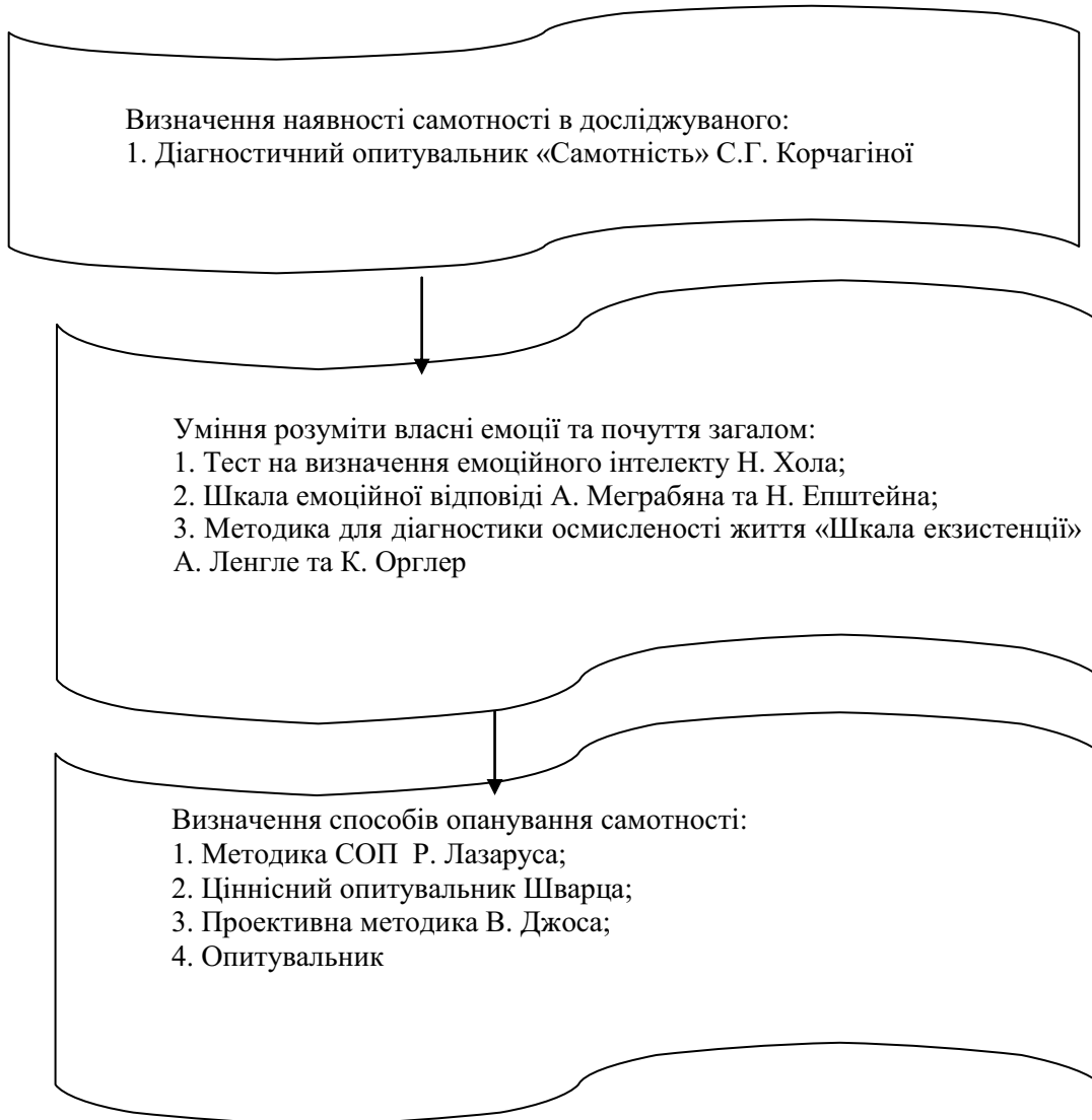
Рис. 3. Модель емпіричного дослідження способів опанування самотності

Модель емпіричного дослідження способів опанування самотності жителями мегаполіса нами було побудовано за результатами пілотажного дослідження та на основі проведеної теоретичної роботи (рис. 3).