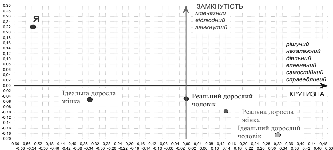
Рис. 2. Семантичний простір факторів 1 і 3 в загальній вибірці

На діаграмі чітко видно, що за обома факторами образ «Я» протилежний «Ідеальному дорослому». Тобто випробовувані давали протилежні оцінки цим образам під час тестування. Можна помітити, що між ними, практично на одній лінії, розташовуються «Реальна доросла жінка» і «Реальний дорослий чоловік».